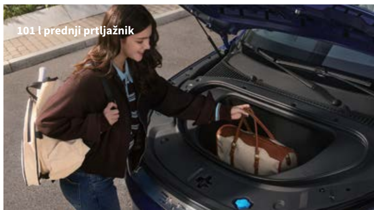
101 l prednji prtljažnik