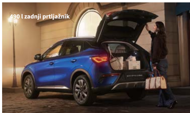
490 l zadnji prtljažnik