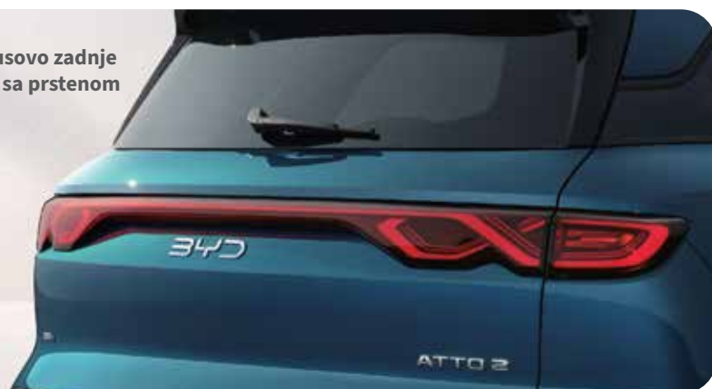
Mebijusovo zadnje svetlo sa prstenom