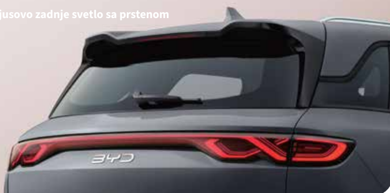
Mebijusovo zadnje svetlo sa prstenom