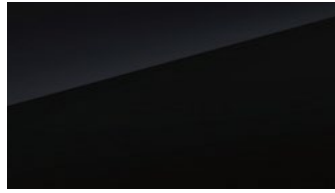
Polar Night black