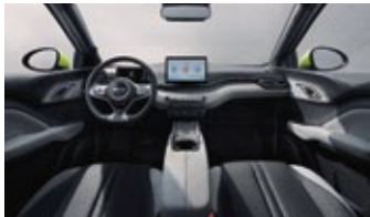
Crna i siva